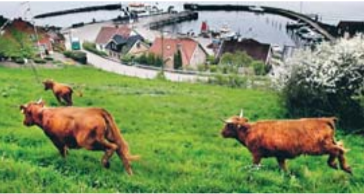
Ven lockar årligen 160 000 besökare.

Men visst finns det också lokala sevärdheter i nordväst. Förra året listade Position Skåne dessa. Ibland med uppskattade besöks-siffror. Här är listan på några av de mest besökta sevärdheterna i